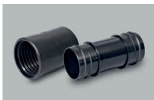
Przyłącze węża 38 mm / 50 mm