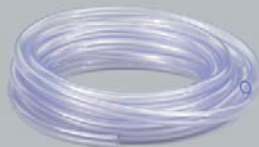
Wąż do odprowadzania skroplin 12x2 mm / 15x2 mm