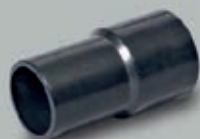
Przyłącze z tworzywa PVC 38 mm / 50 mm