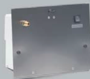
Zestaw odpompowujący Seria AD