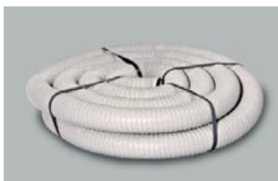
Wąż Thermaflex 80 mm / 100 mm