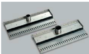
Dysza krawędziowa 38 mm / 50 mm