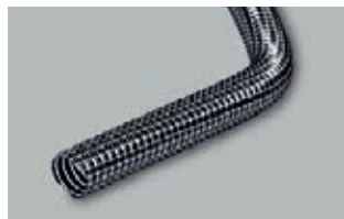
Wąż elastyczny PVC 38 mm / 50 mm