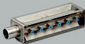
Zestaw do fug 38 mm / 50 mm