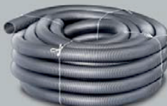
Wąż PE 50 mm