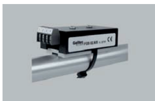
Czujnik punktu rosy FGS