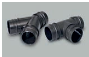
Rozdzielacze Y i T 38 mm / 50 mm