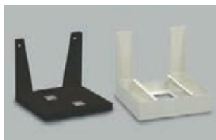
Wspornik ścienny Seria AD