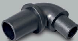
Złącze podłogowe 38 mm / 50 mm