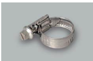
Opaska zaciskowa na wąż 12x2 mm / 15x2 mm